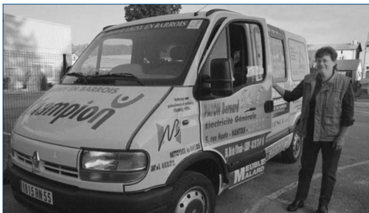
> Odile Boucher pilote la navette, au service des Linéens.

Ce besoin a été approché de diverses manières pour trouver une formule adaptée et économiquement raisonnable. C'est la raison pour laquelle il aura fallu un peu de temps pour que ce nouveau service voie le jour.