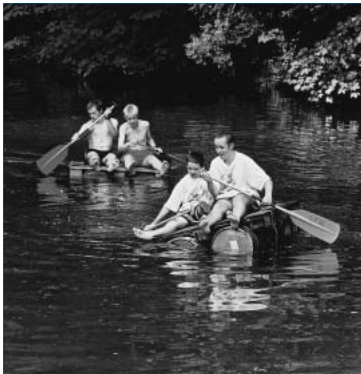
> D'agréables moments en perspective au fil de l'eau