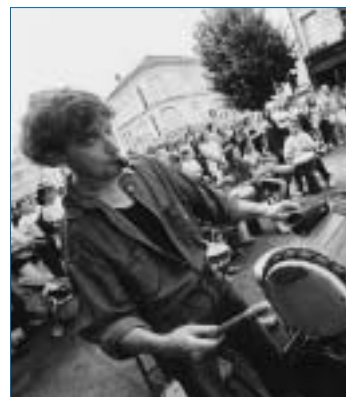
> Venez voir les musiciens !

Ce grand rendez-vous se verra avant tout convivial. C'est pourquoi, nous avons choisi différents lieux d'expression dans un premier temps, avant de regrouper tous les participants, dans la soirée, place de la République.